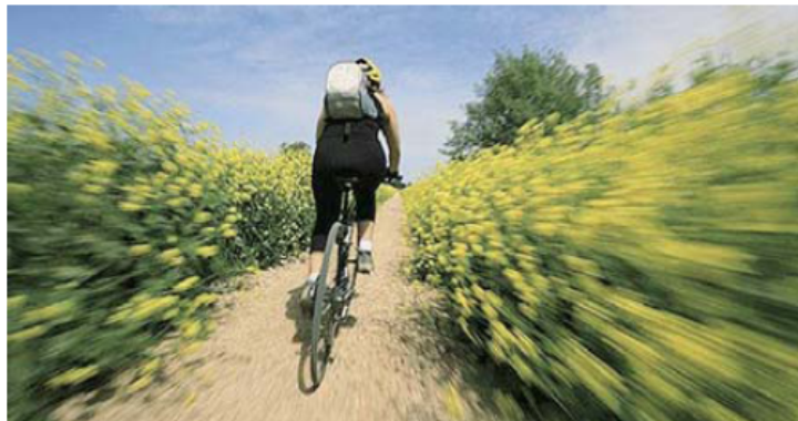
Vacanze slow Sopra cicloturista lungo il sentiero del Canale Maestro. A sinistra la mappa del percorso. Nel tondo immagine votiva, per strada, vicino Cortona

In bici In Val di Chiana apre un percorso per cicloturisti